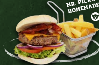
MR. PICKWICK'S HOMEMADE GOURMET BURGER