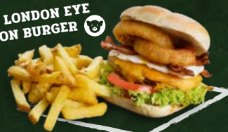
THE LONDON EYE ONION BURGER