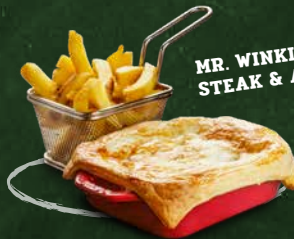
MR. WINKLE'S STEAK & ALE PIE