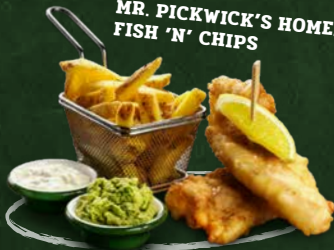
MR. PICKWICK'S HOMEMADE FISH 'N' CHIPS