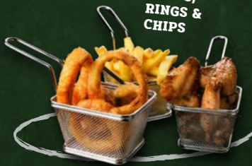
WINGS, RINGS & CHIPS