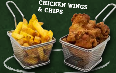
CHICKEN WINGS & CHIPS